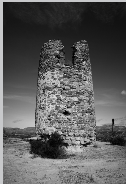
Torreta de la Terdiguera o Albujaia en Albox