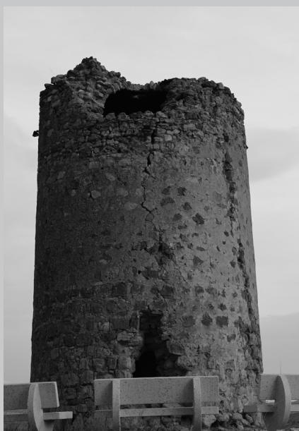
Torre del Ramil en Hijate

guramente dependiente o vinculada militarmente al hins de Oria.