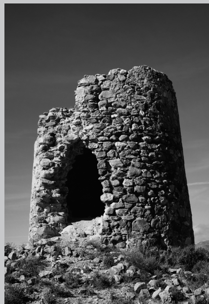
Torreta de la Rambla de Oria