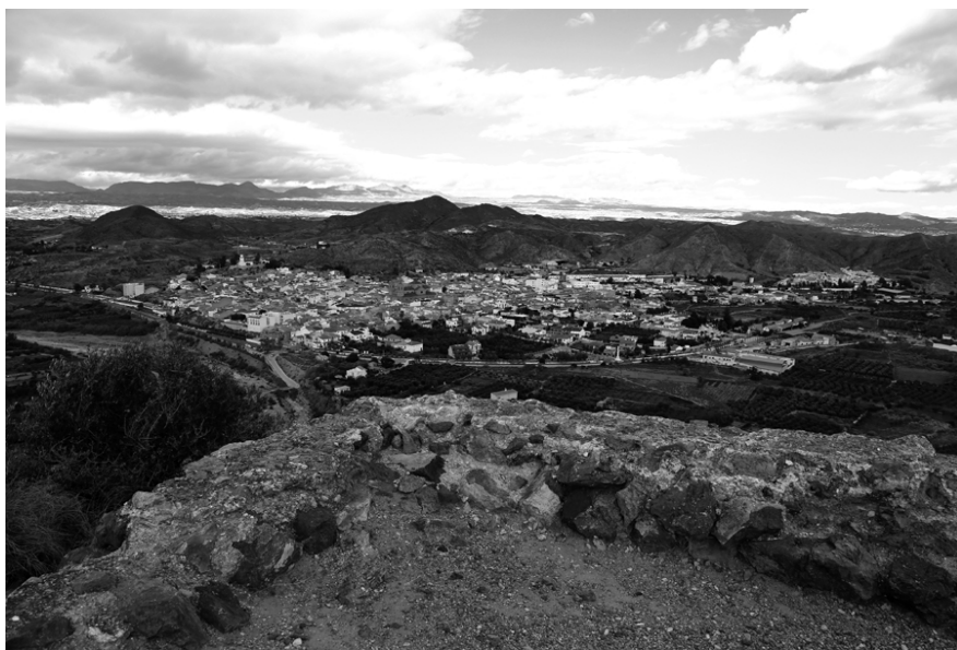
Imagen tomada desde la torre del Cerro Castillo de Cantoria en dirección a la población y a la Torreta.

corresponde con el Lugar del Peñón Viejo. Esta inversión realizada por las élites centrales y supervisadas por el mismo Yusuf I asegura el camino Lorca-Baza. Las torres y atalayas que se encuentran en esta franja son las de el Ramil, Atalaya de Purchena y la Torreta de Cantoria, en esta línea defensiva se pudo ahorrar la élite central su inversión pues mediante hins y puntos estratégicos como Somontín el camino estaba salvaguardado. También las fuentes nos aseguran gracias a la traducción que Lirola ha hecho de Ibn al-Jatîb la línea que salvaguarda el camino de Lorca-Baza desde Cantoria a Vélez: " Cantoria (Qantûriya/Qatturiya), con buen queso y deliciosa miel y escasez de agua; Purchena (Bursana), con un inexpugnable castillo; Oriá (Ûriya), tierra con agua que produce