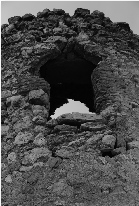
Ventana que hacía la función de puerta de entrada en la torre del Ramil en Hijate

queso, miel y cebada; Vélez (Ballís), con los peligros de frontera, que cuenta con manantiales, caza y miel, pero con poco trigo (...) ”. Esta línea corresponde a las tres torres que salvaguardan el camino hacia el Norte (la Torreta de Cantoria, la Terdiguera y la Torre de la Rambla de Oria).