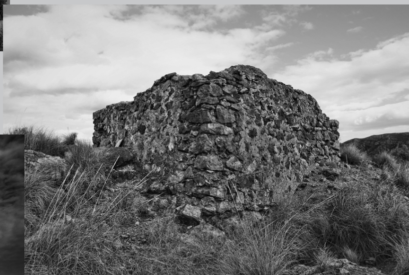
Restos de la torre cuadrada del Cerro Castillo de Cantoria, donde recibía las señales de la Torreta y daba señal al Peñón del Lugar Viejo