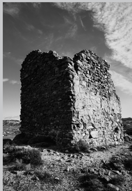
Torre cuadrada de la Aljambra en Albox

La cronología de la torre es del siglo XIV. Su función es plenamente defensiva estando vinculada al hins de Oria y asociada a la línea que salvaguarda el camino Lorca-Baza. La torre estaría aislada, se-