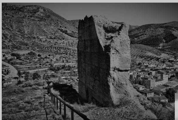
Ruinas del Castillo de Oria, que recibía la señal de la torre de la Rambla de Oria