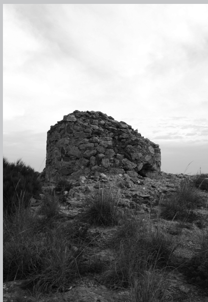
Atalaya de Purchena