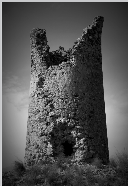
Torreta de Cantoria