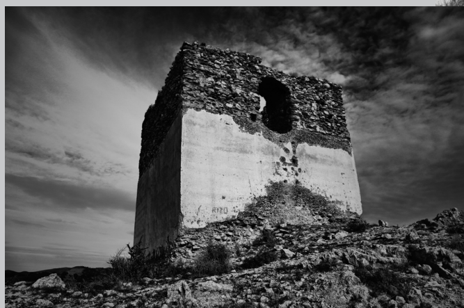
Restos del Castillo de Overa, en la barriada de Santa Bárbara