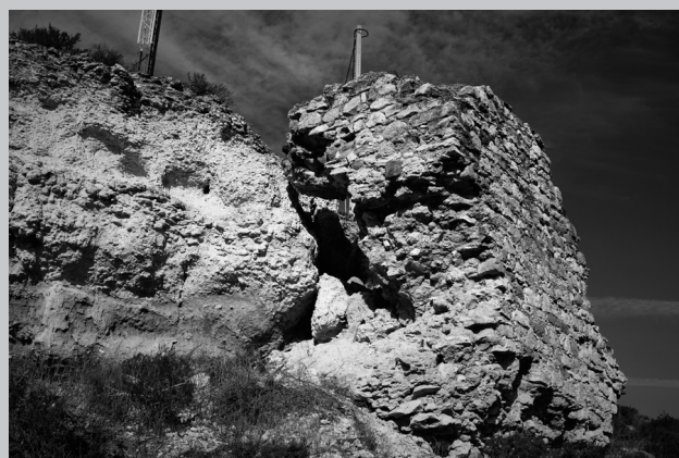
Restos de las murallas del Castillo de Albox