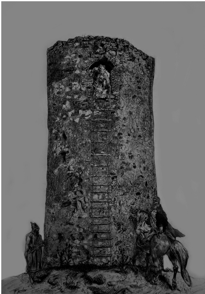
Recreación del cambio de guarnición en una torreta defensiva. (Dibujo: Francisco Soler García).