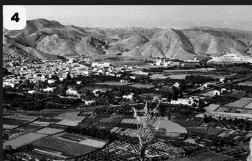
1-Familia de Diego Uribe.