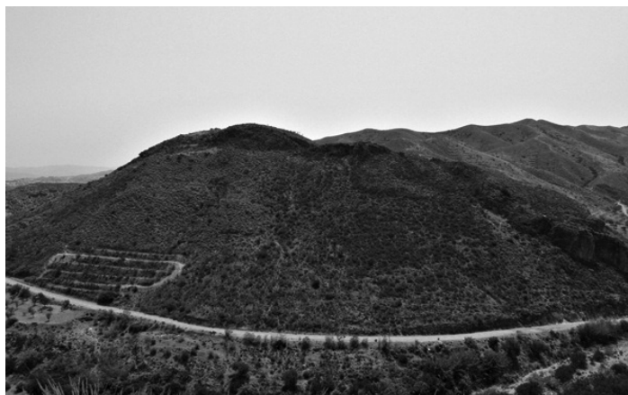
Cerro de los Aljibes, por encima de la cortijada de las Gachasmigas y la desembocadura del Arroyo Albánchez, antiguo emplazamiento de Almanzora en la época musulmana.

En la crónica de Ibn Hayyan, se cuenta muy detalladamente la operación que tuvo lugar en el año 896 contra los rebeldes de Tudmir. Las tropas del Emir Abd Allah, mandadas por el qaid Ahmad ben Muhammad ben Abba, cruzan las tierras de Jaen, sacan a los rebeldes de Alicún de Ortega y los sustituyen por árabes y bereberes, pasan por Guadix, en Hisn Winya (Huéneja) perciben los tributos de Pechina y Basiria (que no se sabe que población es, aunque posiblemente fuera Baira), bajan hasta Gergal, cruzan la Sierra de los Filabres y caen sobre Ragsana Tayila, en realidad son dos plazas distintas y distantes, pues entre ambas ha faltado la conjunción /y/, pero Tayila si es el Hisn Tayila, es decir, castillo de Tíjola, hoy este Hisn es conocido como Atarf o Tarf, que era la primitiva Tíjola, es decir, la Tíjola de esa época, pues la actual se formó varios siglos después, y pudo suceder: