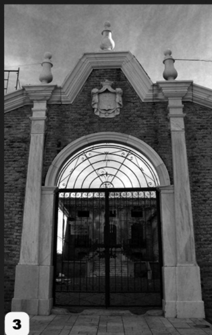
1-Palacio de Jabalquinto, actual sede de la Universidad Antonio Machado

2-Posá de Almanzora. En la placa se puede apreciar la siguiente inscripción: “Se hizo esta obra de orden del excelentísimo Señor Marqués de Villafranca y de los Vélez. Su administrador de esta su Almanzora Manuel Martínez de Lejarza. Año de 1771”.