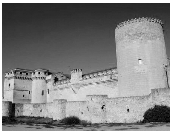
Villa de Cuéllar

- Castejón : Origen Navarro, de la Villa antigua de Castejón de la Barca.