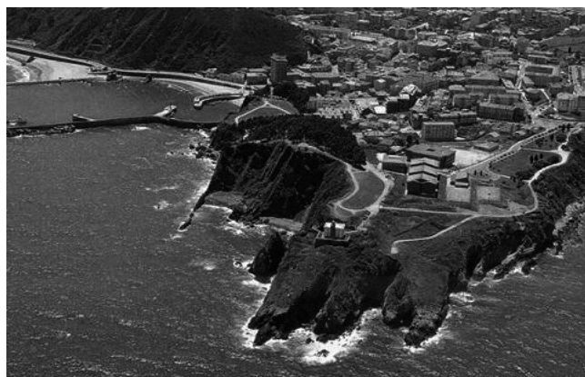
Concejo de Carreño

- Carreras : Apellido asentado en Cataluña, originario de la región italiana de Carrara.