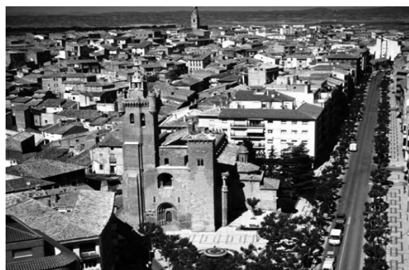
Egea de los Caballeros

- Gázquez : Originario de Murcia y Andalucía oriental.